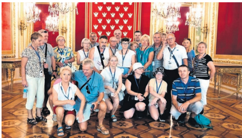
Sala tronowa w Zamku Królewskim.

W ramach działalności koła na tej wycieczce w sali tronowej Zamku