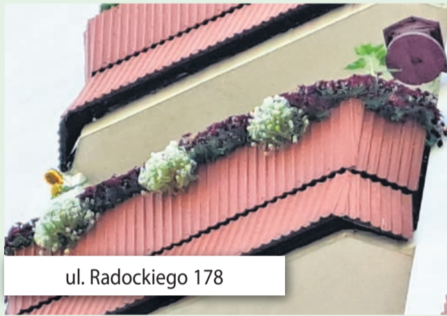
ul. Radockiego 178