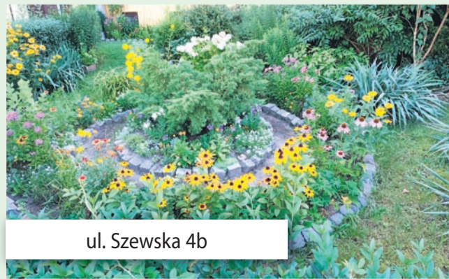
ul. Szewska 4b