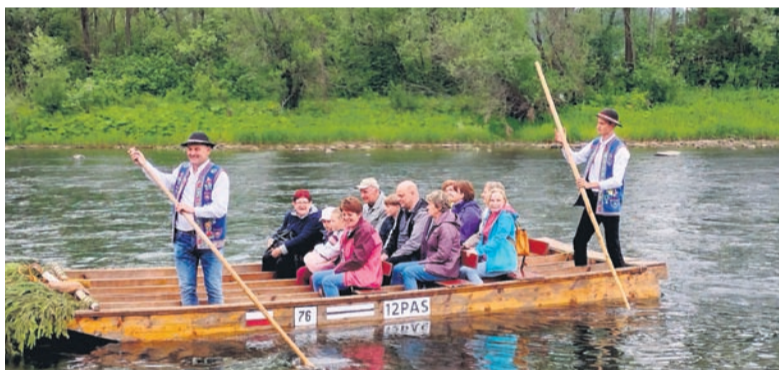
Wycieczka w Pieniny. Spływ Dunajcem.

Królewskiego wręczyliśmy dwie legitymacje nowo wstępującym do koła osobom.