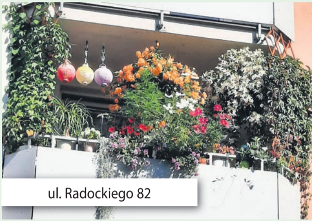
ul. Radockiego 82