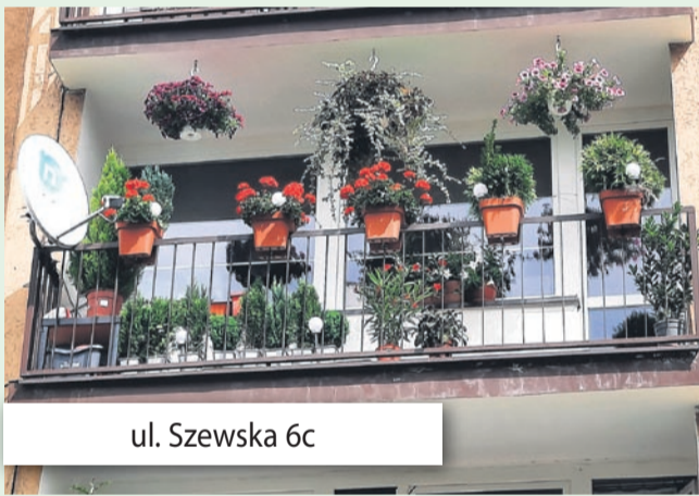
ul. Szewska 6c