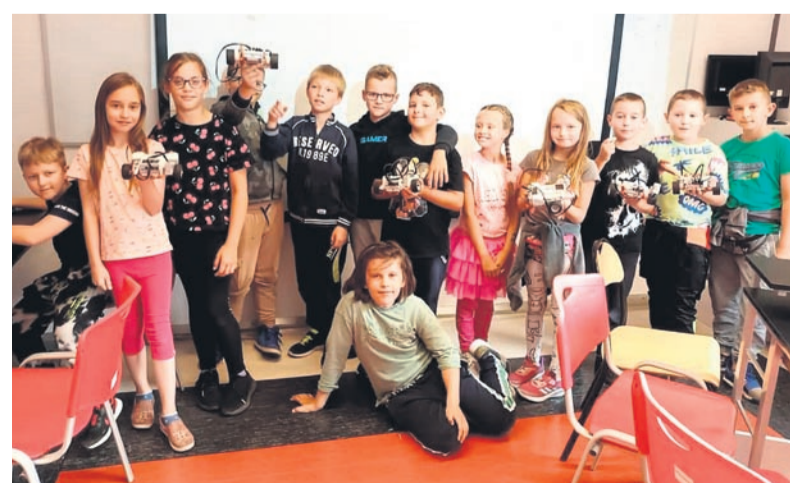
Warsztaty z robotyki w Pałacu Młodzieży.