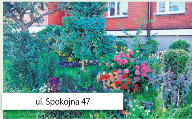
ul. Spokojna 47