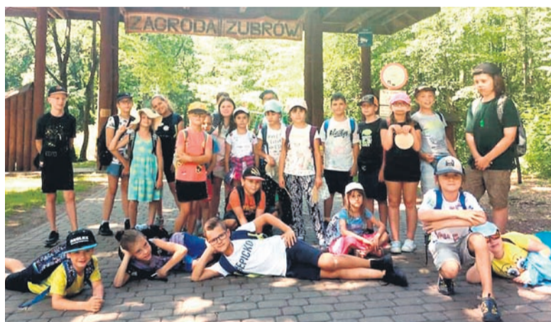
Wycieczka do Zagrody Żubrów w Pszczynie.