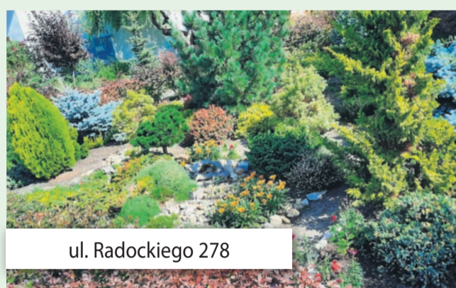
ul. Radockiego 278