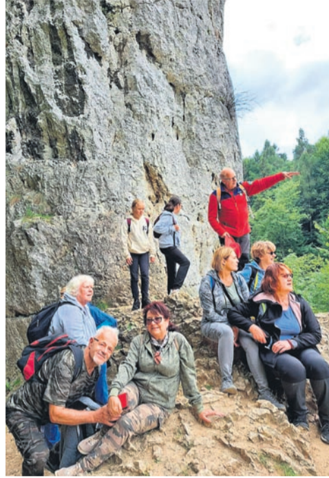
Chwila odpoczynku podczas wędrowki.

Szlak oznakowany kolorem żółtym poprowadził częściowo drogą asfaltową, aby po 20 minutach marszu znaleźć się na obszernej łące i ostatecznie przez las trafić do podnóża słynnej skałki o nazwie „Maczuga Herkulesa”. Stąd piękna panorama na wysoko wybudowany zamek. Po krótkiej, ale intensywnej wspinaczce pod maczugę przewodnik poprowadził uczestników do zamku Pieskowa Skała. Tu nastąpiła przerwa kawowa, a wyznaczony czas wolny każdy zrealizował we własnym zakresie. Następnie cała grupa udała się do agroturystyki na Podzamczu, gdzie przygotowany był dla nas posiłek – wyśmienite grillowane krupnioki i kiełbaski. W trakcie wycieczki przewodnik opowiadał o mijanych obiektach, a także o historii zamku, dawnych właścicielach i obecnej sytuacji. Wycieczka odbyła się w sympatycznej atmosferze, przy sprzyjającej pogodzie i smacznym posiłku. Jak to zwykle bywa, aż żal było wracać.