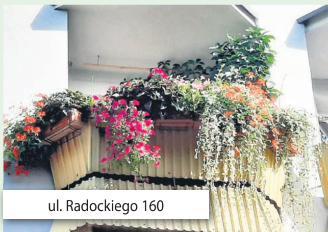
ul. Radockiego 160