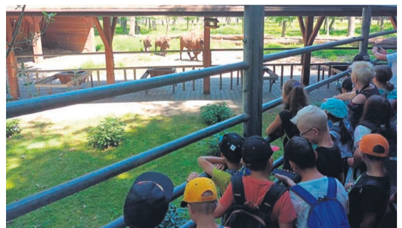
W oczekiwaniu na żubry, które mają akurat porę karmienia.