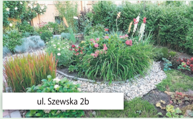
ul. Szewska 2b