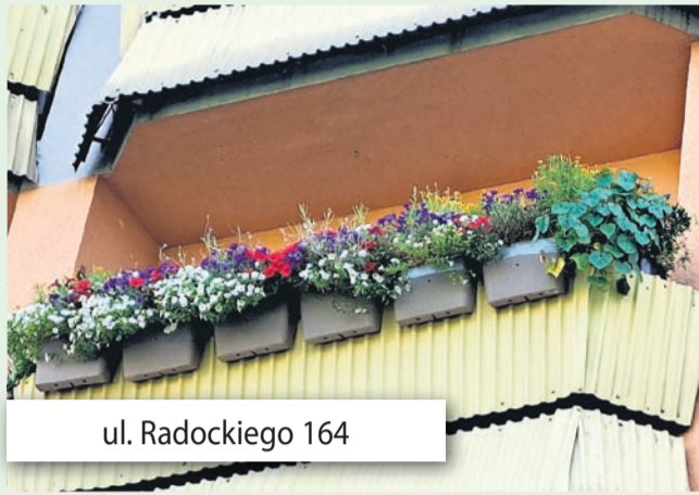
ul. Radockiego 164