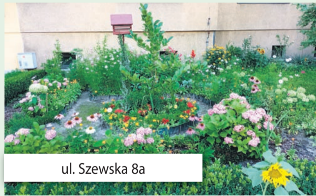
ul. Szewska 8a