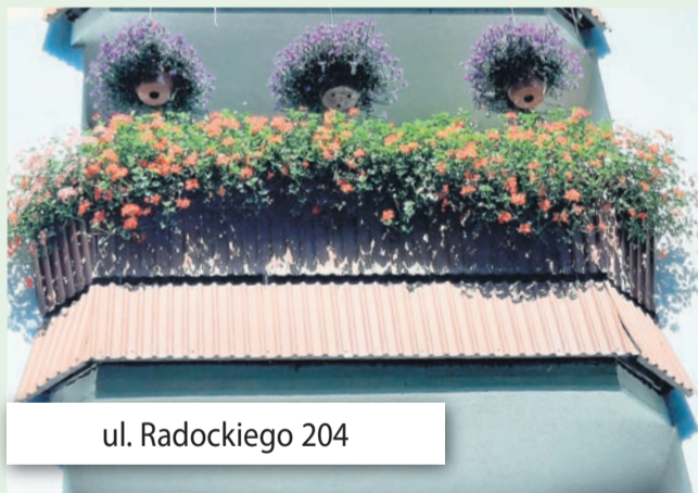
ul. Radockiego 204