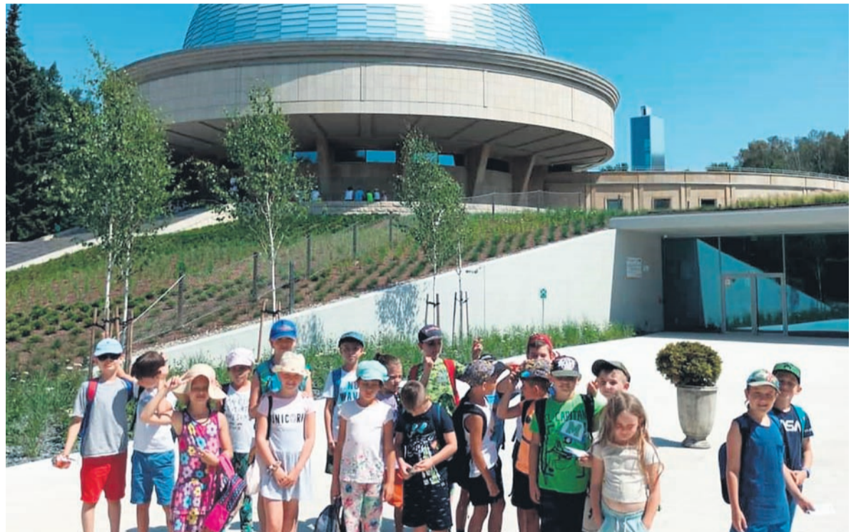
Wizyta w Planetarium Śląskim w Chorzowie.