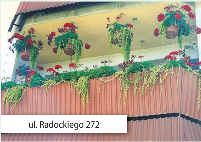
ul. Radockiego 272