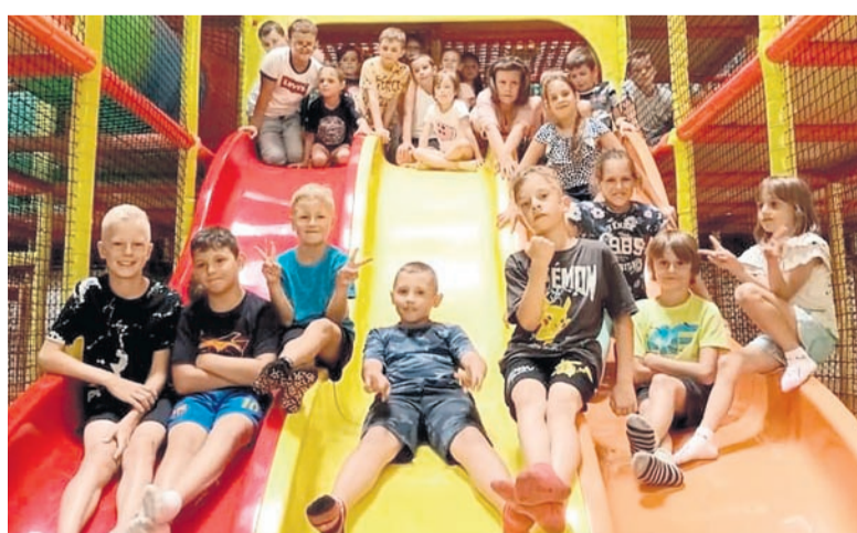
Zabawa w Centrum Rozrywki Guliwer.