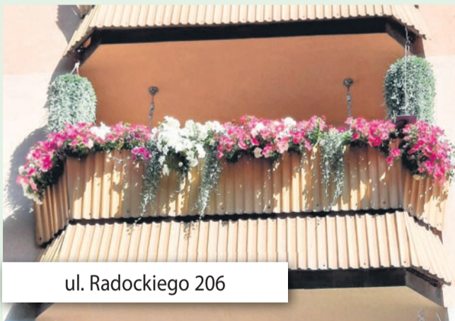
ul. Radockiego 206