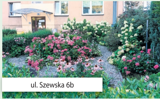
ul. Szewska 6b