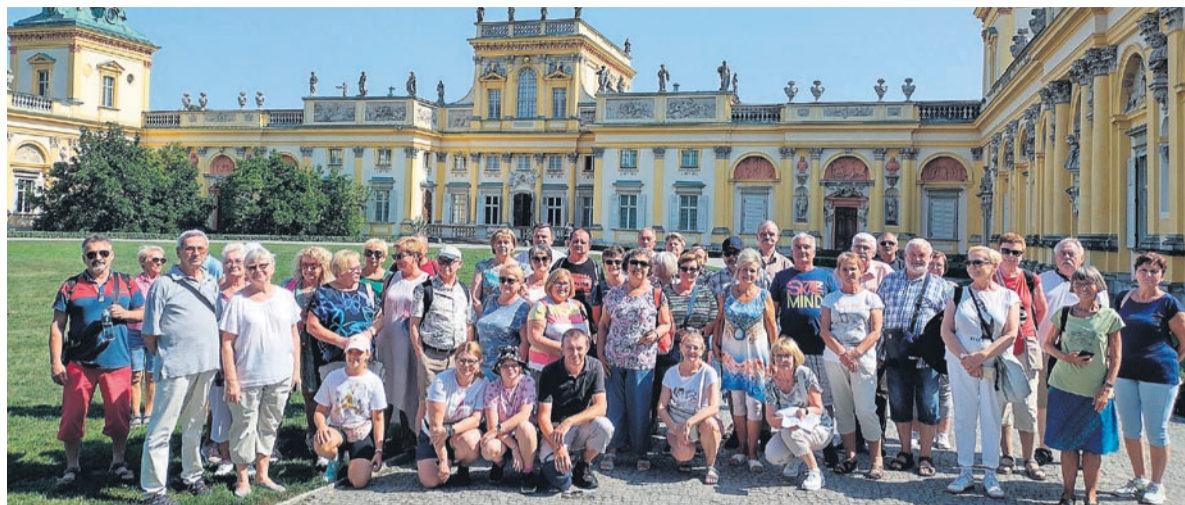
Wycieczka do Warszawy. Pamiątkowe zdjęcie przed Pałacem w Wilanowie.

W minionym czasie koło PTTK nr 77 działające w naszych zasobach zorganizowało dwa wyjazdy, na początku czerwca wyjazd w Pieniny na spływ Dunajcem oraz w dniach 27-28 sierpnia wyjazd do Warszawy.