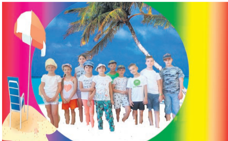
Zdjęcie poddane obróbce podczas warsztatów przez jednego z uczestników Akcji Lato.