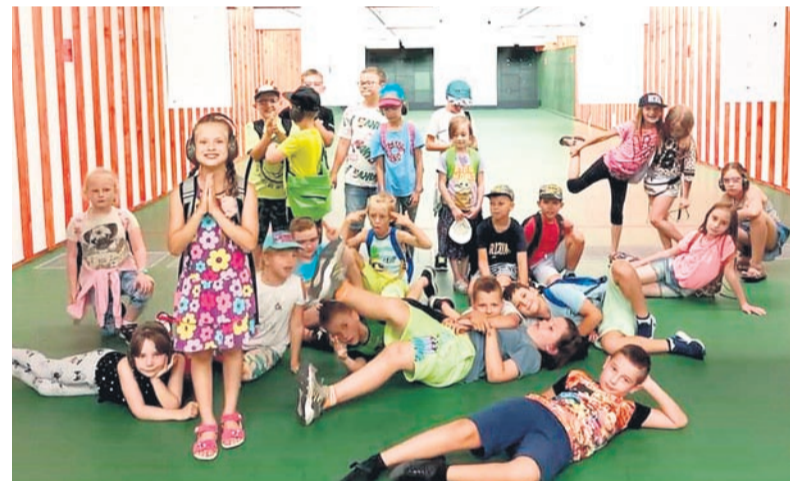
Na terenie nowoczesnej strzelnicy, która mieści się w Szkole Policji w Piotrowicach.