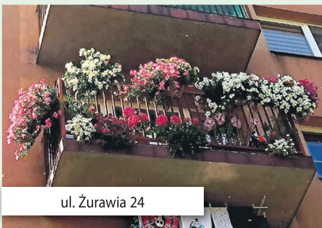
ul. Żurawia 24