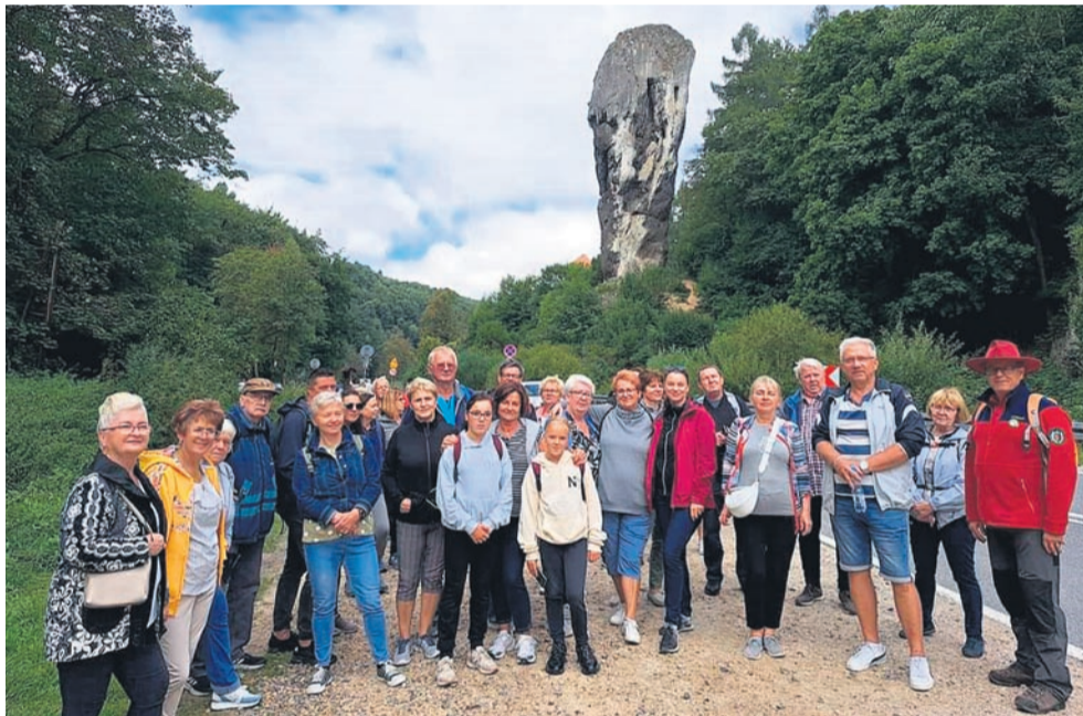
Słynna Maczuga Herkulesa na drugim planie.