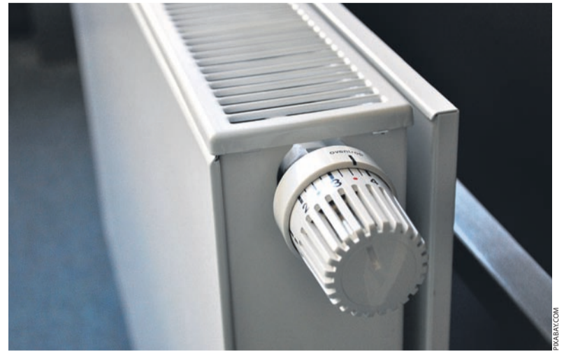
Nikt z nas nie jest w stanie przewidzieć jak będą kształtowały się ceny w całym nadchodzącym sezonie grzewczym.

Spółdzielnia „SILESIA” podjęła również rozmowy z firmą VEOLIA przedstawiając pomysł wydzierżawienia kotłowni zasilających w ciepło ww. budynki. Takie rozwiązanie pozwoliło-