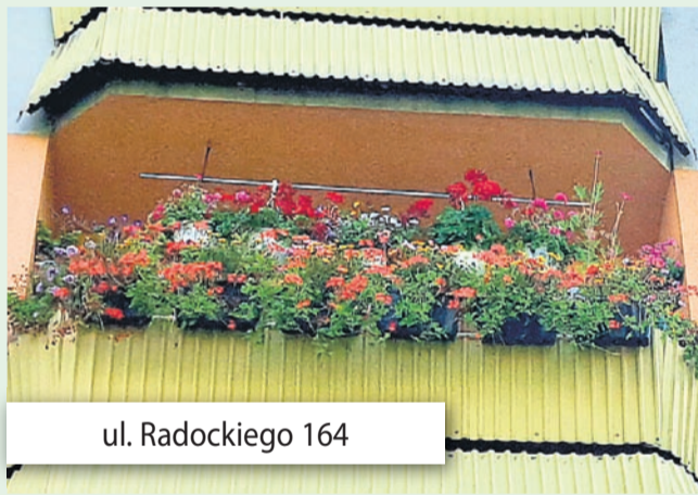
ul. Radockiego 164