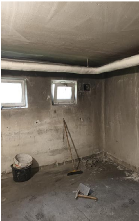
Suszarnia i rowerownia przy ul. Szewskiej 4b przed remontem...