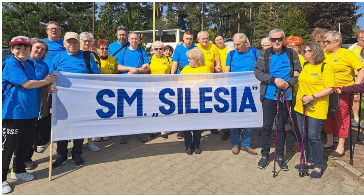
Grupa w niebiesko-żółtych koszulkach dotarła do mety.

27 maja 2023 roku, na terenie Jury Krakowsko-Częstochowskiej w Podlesicach, odbył się XVIII Piknik Osób Niepełnosprawnych. Wydarzenie to, zgodnie z hasłem „Nie jesteś sam”, było okazją dla uczestników zasobów mieszkaniowych spółdzielni województwa śląskiego, aby po trzech latach przerwy spowodowanej pandemią Covid-19 ponownie się spotkać na terenie Gościńca Jurajskiego.