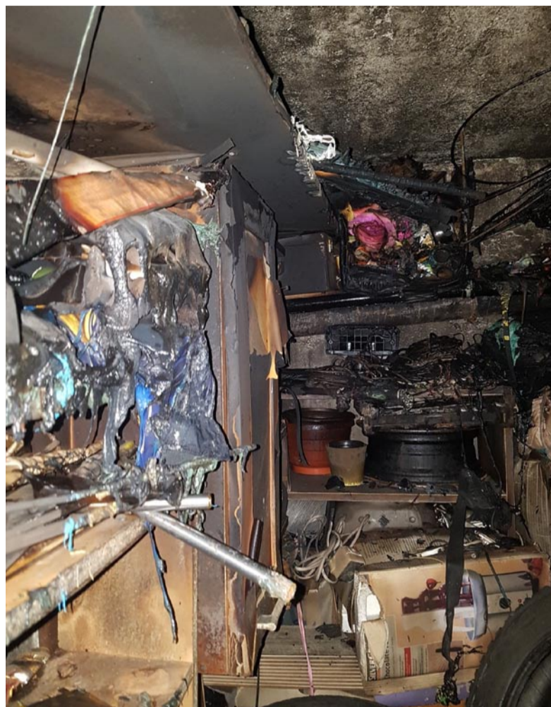
Pożar w piwnicy budynku przy ul. Radockiego 52 (2019 rok).

Zdecydowanie bardziej sprawa komplikuje się w przypadku wystąpienia pożaru w związku ze składowaniem rzeczy na klatce schodowej gdzie kara może wynieść od 3 miesięcy do 5 lat pozbawienia wolności, a w przypadku gdy ktoś ucierpi bądź straci życie, grozi nawet 8 lat więzienia.