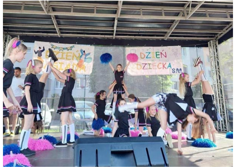
Cheerleaderki ze Szkoły Podstawowej nr 27 zrobiły krótkie show.