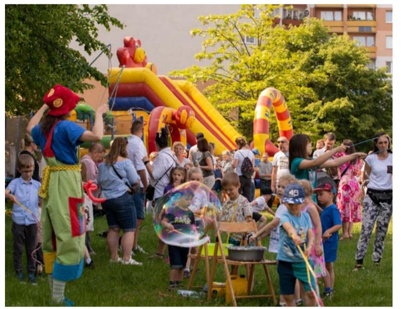
Dmuchańce to zawsze jedna z najlepszych atrakcji dla dzieci.