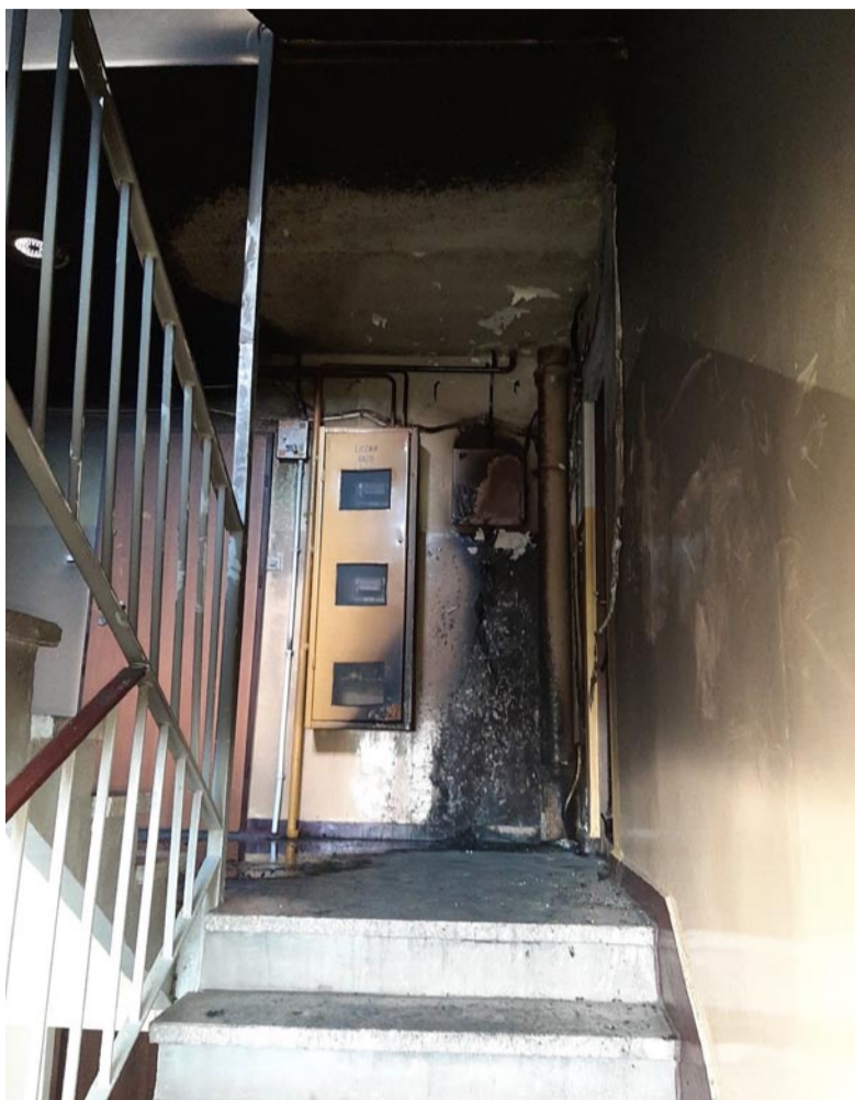
Pożar na klatce schodowej w budynku przy ul. Radockiego 118 (2021 rok).

W związku z wyżej przytoczonymi aktami prawnymi zabronione jest przechowywanie substancji i materiałów niebezpiecznych, łatwopalnych, zasta-