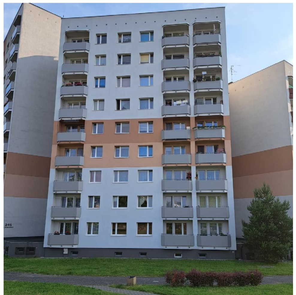
Wyremontowane balkony w budynku przy ul. Radockiego 244.