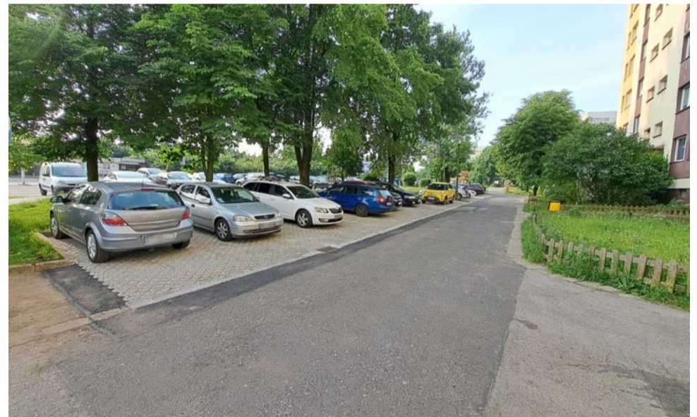
Wyremontowane miejsca parkingowe przy ul. Radockiego 56-58.