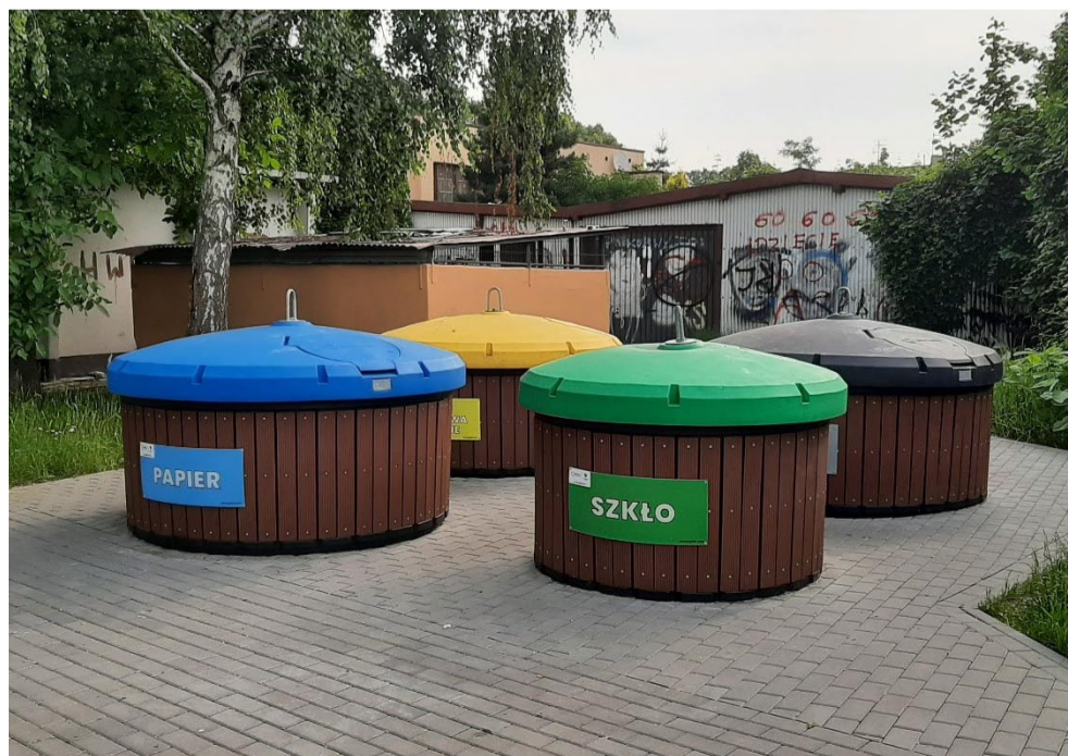
Pojemniki półpodziemne przy ul. Zbożowej 11 wybudowane w 2022 roku.

Starania Spółdzielni oraz przychylność MPGK w zakresie tych inwestycji ma wpływ na utrzymanie porządku oraz poprawę estetyki na naszych zasobach.