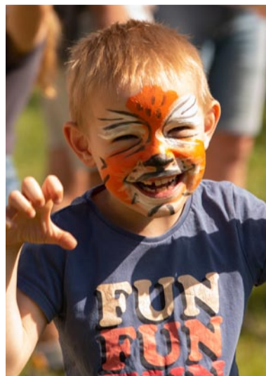
Drapieżne, ale i słodkie buźki wypatrzone w tłumie.

Kolejne inicjatywy lokalne tj. „Piknik Kartofla”, akcja edukacyjna dla miłośników psów i kotów – „Podaj Łapę” oraz „ABC Zdrowia” będą realizowane jesienią.