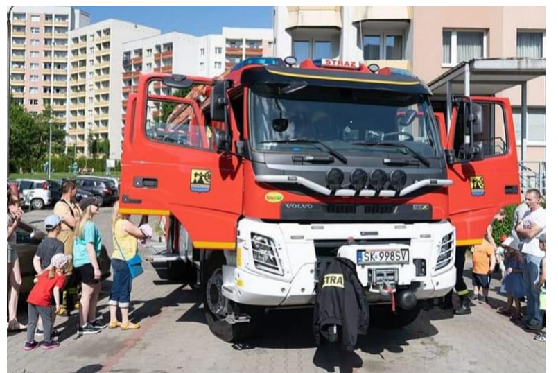
Wóz strażacki OSP Kostuchna można było obejrzeć nie tylko z zewnątrz.