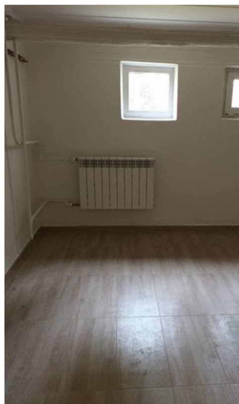
... i po remoncie.