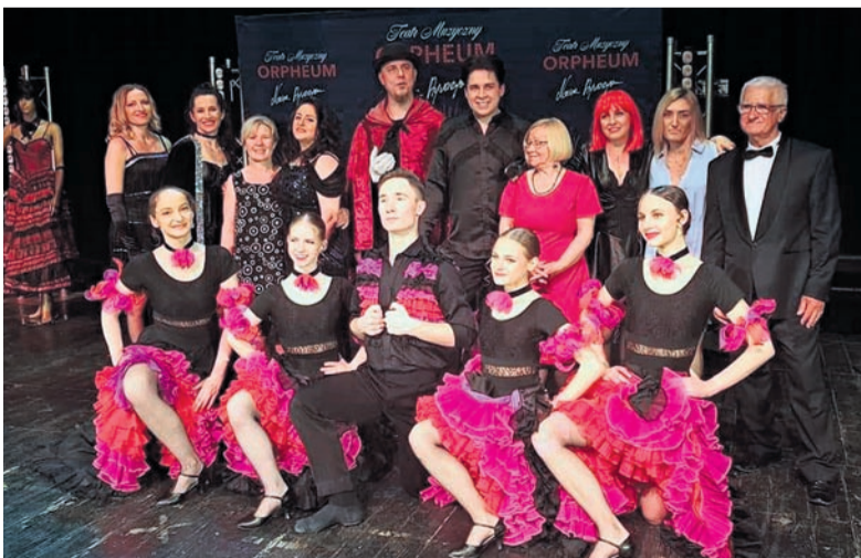
Artyści na scenie i za kulisami podczas występu w Miejskim Ośrodku Kultury w Zawierciu.