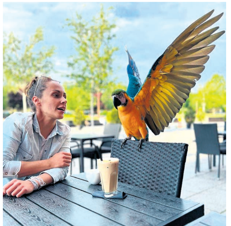
Ara z Piotrowic ma smykałkę do uczenia się słów. Trzeba przez to uważać, co się przy niej mówi.

Na razie to jednak jeszcze melodia przyszłości, a tymczasem można się cieszyć chociażby wspólnymi wakacjami, jak w ubiegłym roku w Chorwacji, gdyż podróże nie tylko samochodem też nie są naszym bohaterowi obce.