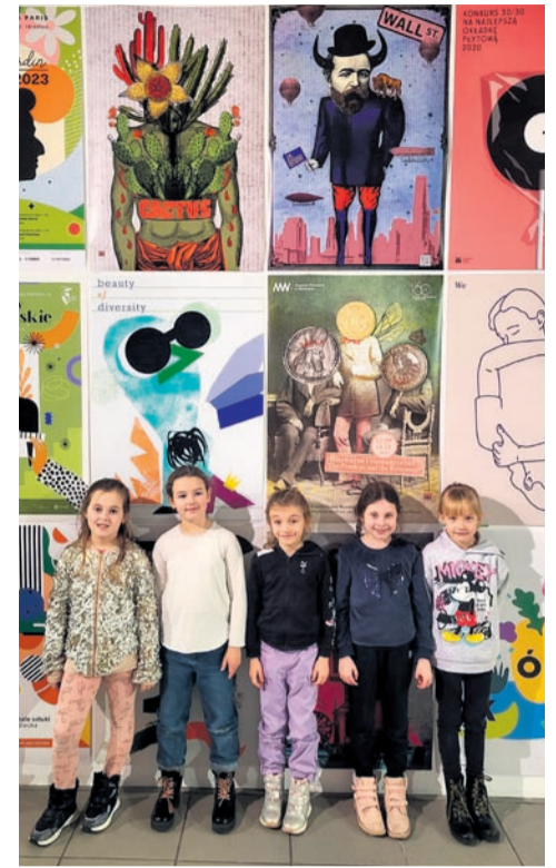
Warsztaty twórcze zorganizowane w Galerii Sztuki Współczesnej BWA.