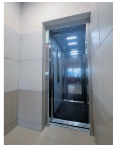
Wymiana windy wraz z wybudowaniem dodatkowego przystanku na poziomie ciągu pieszo-jezdnego w budynkach przy ul. Radockiego 246 i 248.