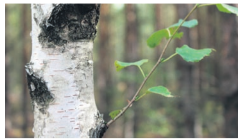
Sok z brzozy jest napojem o niezwykłych właściwościach i bogatej historii.

Dzięki tym składnikom, sok z brzozy ma wiele korzystnych efektów na zdrowie i samopoczucie. Oto niektóre z nich: