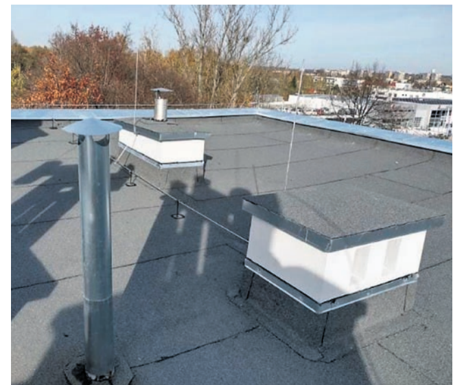
Dach w budynkach przy ul. Żurawiej 44, 43 i 68 przed i po remoncie.