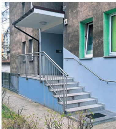
Remont schodów wejściowych do klatki schodowej w budynku przy ul. Północnej 4.