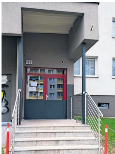
Remont schodów wejściowych do klatki schodowej w budynkach przy ul. Radockiego 196, 228 i 230.