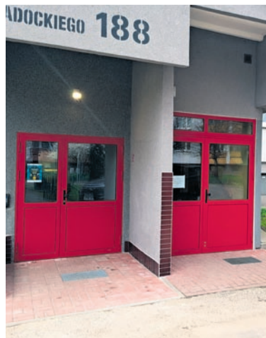
Wymiana windy wraz z wybudowaniem dodatkowego przystanku na poziomie ciągu pieszo-jezdnego w budynkach przy ul. Radockiego 62, 188, 216 i 272.