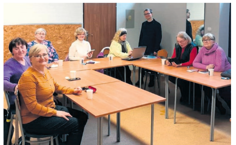
Podczas bezpłatnych szkoleń, uczestnicy zdobywali wiedzę na temat korzystania ze smartfonów.

W klubach osiedlowych SM „Silesia” przy ul. Północnej, Żurawiej i Radockiego odbyły się bezpłatne warsztaty z obsługi smartfona dla seniorów, zorganizowane i przeprowadzone przez Miasto Katowice. W sumie odbyło się piętnaście spotkań, w których wzięło udział około 60 seniorów. Organizatorzy zapewnili smartfony z systemem Android na czas trwania szkolenia. Podczas 3-godzinnych zajęć uczestnicy, delektując się kawą i ciastkiem, zdobyli wiedzę na temat obsługi smartfona, wysyłania zdjęć, odkrywania nowych miejsc i informacji, dokonywania zakupów oraz – korzystając z aplikacji – szybko i bezpiecznie poruszania się pieszo lub środkami komunikacji miejskiej. Szkoleniowcy omówili również z seniorami podstawowe zasady cyberbezpieczeństwa, ponieważ oszustwa internetowe