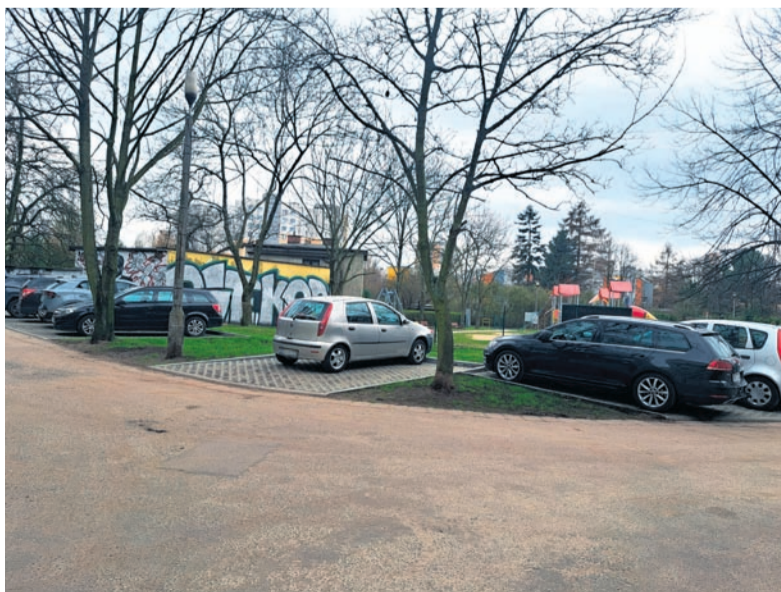
Remont miejsc parkingowych przy ul. Radockiego 90.