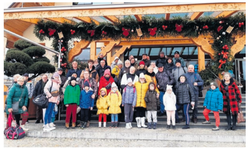
Grupa mieszkańców w największym kompleksie wypoczynkowym na Podhalu.

7 lutego 53-osobowa grupa mieszkańców Spółdzielni Mieszkaniowej „Silesia” udała się na wycieczkę do Term Chochołowskich, największego kompleksu wypoczynkowego z wodami termalnymi na Podhalu. Uczestnicy mieli okazję skorzysta z relaksacyjnych i leczniczych kąpiel, które nie tylko przynoszą ulgę, lecz także mają wartości terapeutyczne. Najmłodszy członek grupy mogli natomiast rozkoszować się zabawą w strefie przeznaczonej dla dzieci. Cała wizyta upłynęła pod znakiem relaksu, rozmów oraz odpoczynku, a przede wszystkim wspólnego kąpienia się w basenach, co dostarczyło mnóstwo radości i uśmiechu.