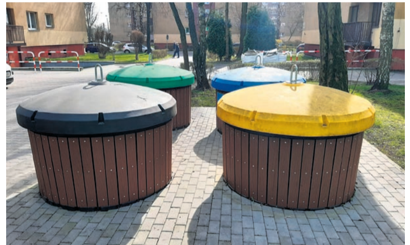
Utworzenie terenu pod pojemniki półpodziemne do selektywnej zbiórki odpadów przy ul. Żurawiej 38-40.