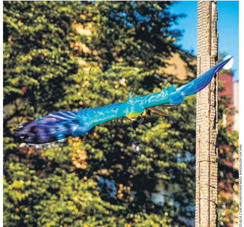
Sąsiedzi już się przyzwyczaili do widoku papugi latającej po okolicy.