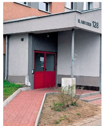
Wymiana windy wraz z wybudowaniem dodatkowego przystanku na poziomie ciągu pieszo-jezdnego w budynku przy ul. Radockiego 128.