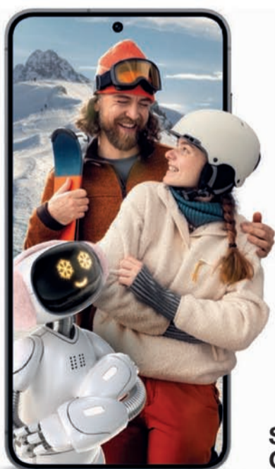
Samsung Galaxy S24 5G

5G jakości Orange Przeniesienie numer komórkowy i zyskaj