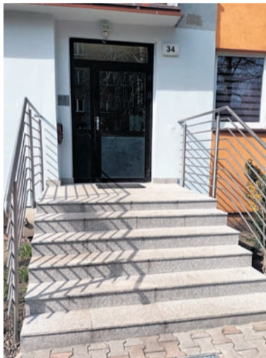
Remont schodów wejściowych do klatki schodowej w budynkach przy ul. Prusa 34, 38B, 38C.