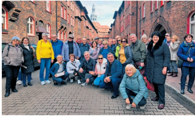
Niepowtarzalny urok osiedla Nikiszowiec.

6 marca grupa 108 pań miała okazję uczestniczyć w kolejnym pokazie Kina Kobiet. Film pt. „Miłość bez ostrzeżenia” został specjalnie dobrany z myślą o żeńskiej widowni i poprzedzony licznymi atrakcjami organizowanymi na sali kinowej. Tego dnia panie zostały poproszone o przybycie w kombinezonach roboczych, a przed wejściem każda z nich otrzymała drobny upominek. Podczas spotkania uczestniczki mogły wziąć udział w różnych ciekawych konkur-