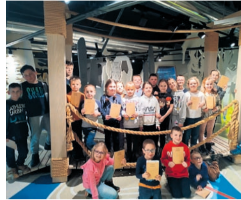
Niezwykła zabawa w przestrzeni edukacyjnej Muzeum Śląskiego.

Serdecznie dziękujemy wszystkim dzieciom za udział i zapraszamy do uczestnictwa w „Akcji Lato”. Zapisy rozpoczną się w czerwcu.