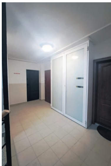
Malowanie klatki schodowej przy ul. Radockiego 248 i ul. Jankego 116 wraz z robotami towarzyszącymi.