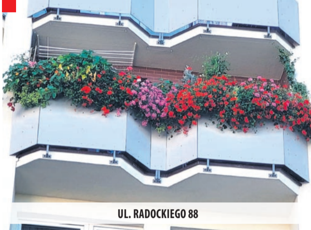
UL. RADOCKIEGO 88