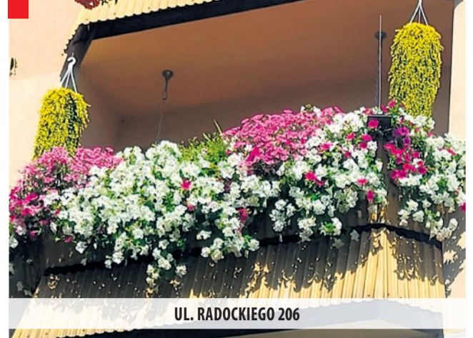
UL. RADOCKIEGO 206