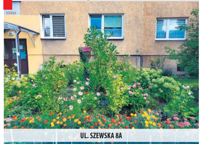
UL. SZEWSKA 8A