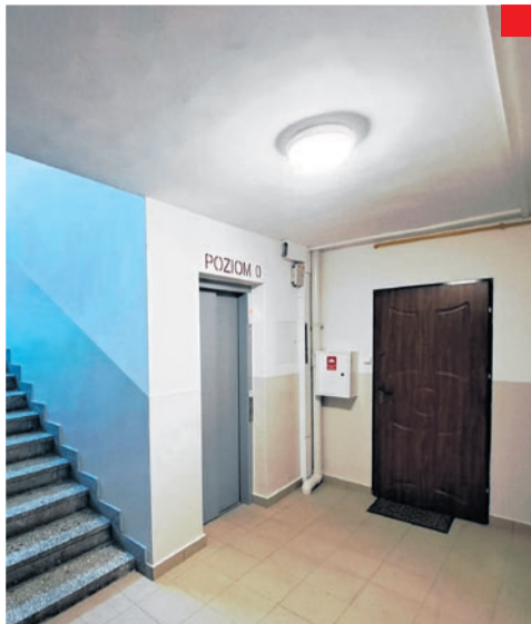
Malowanie klatki schodowej wraz z pracami towarzyszącymi w budynku przy ul. Radockiego 126.