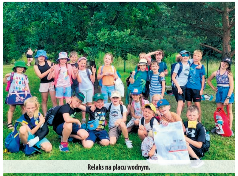
Relaks na placu wodnym.