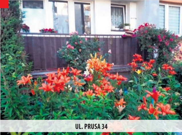
UL. PRUSA 34