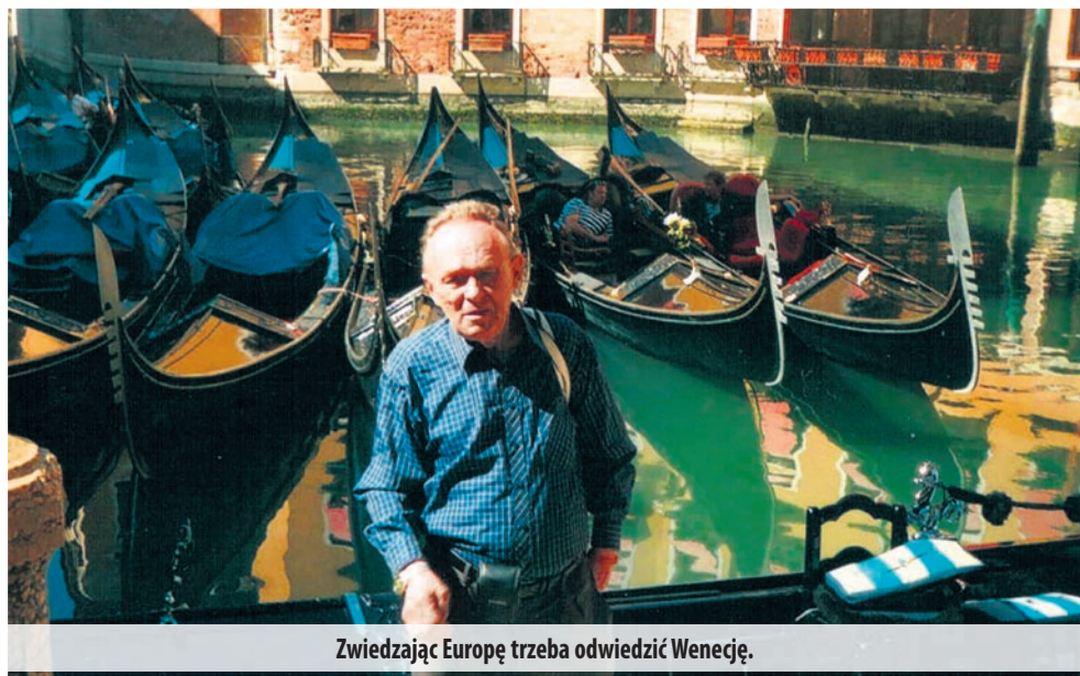
Zwiedzając Europę trzeba odwiedzić Wenecję.