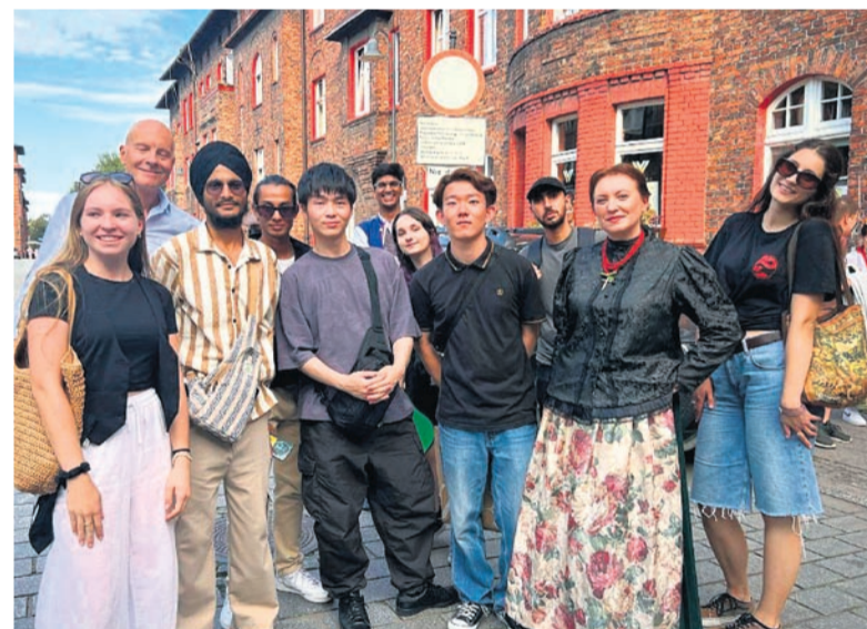
Spacer ze studentami Szkoły Języka Polskiego Uniwersytetu Śląskiego w Katowicach.

Jeśli chodzi o dzielnicę, to współpracuję z Miejskim Domem Kultury w Piotrowicach, prowadząc edukację regionalną dla dzieci przedszkolnych i z pierwszych klas podstawówki. Udzielam się też w chórze działającym pod patronatem spółdzielni jako Towarzystwo Śpiewacze Modus Vivendi. Kontakt mamy.