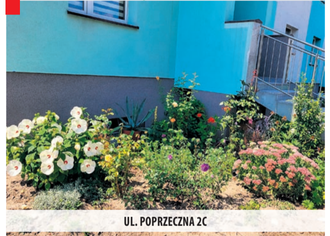
UL. POPRZECZNA 2C