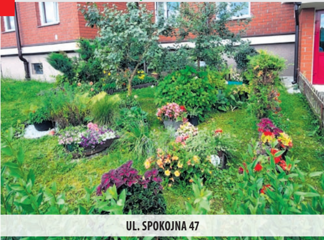
UL. SPOKOJNA 47