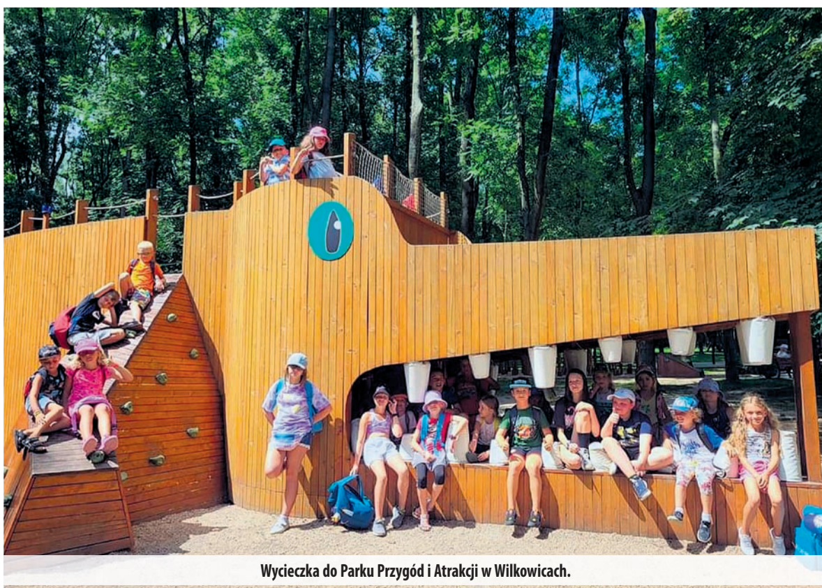
Wycieczka do Parku Przygód i Atrakcji w Wilkowicach.