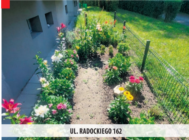
UL. RADOCKIEGO 162