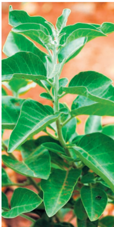
Ashwagandha to roślina o wszechstronnym działaniu.

■ Redukcja stresu i niepokoju: badania wykazują, że ashwagandha może znacząco obniżyć poziom kortyzolu, hormonu stresu, co przekłada się na zmniejszenie objawów lęku i poprawę samopoczucia.