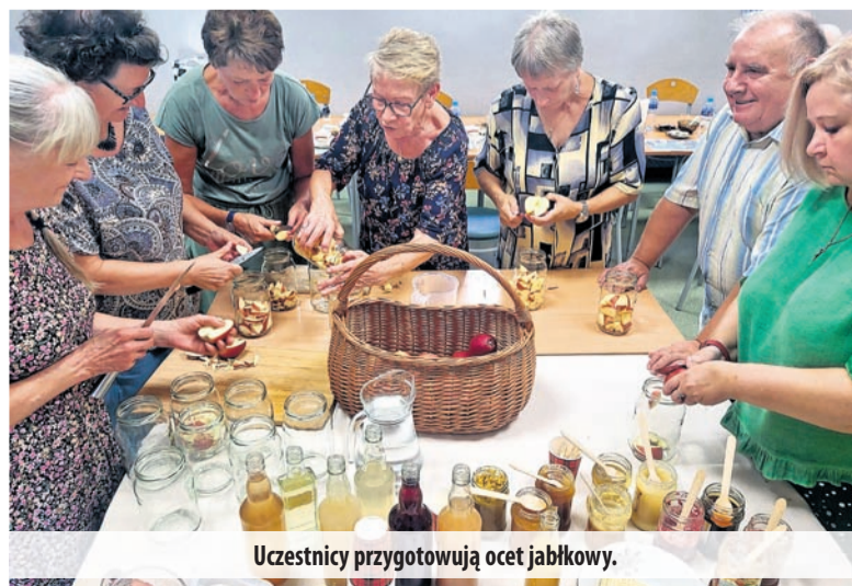
Uczestnicy przygotowują ocet jabłkowy.