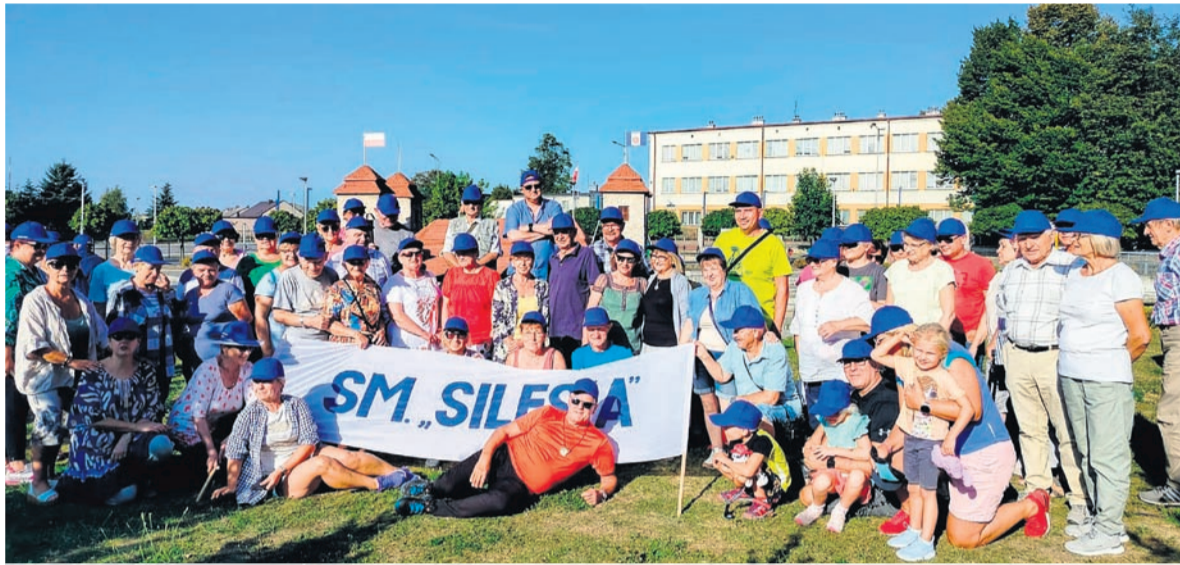
Odpozynek na mecie w Podlesicach.

W sobotę, 7 września, grupa ponad 70 mieszkańców Spółdzielni Mieszkaniowej „Silesia” wzięła udział w 40. Jubileuszowym Złazie Rodzinnym Mieszkańców Spółdzielni Mieszkaniowych Województwa Śląskiego im. Neli i Tytusa Szlompków, który odbył się w malowniczych Podlesicach.