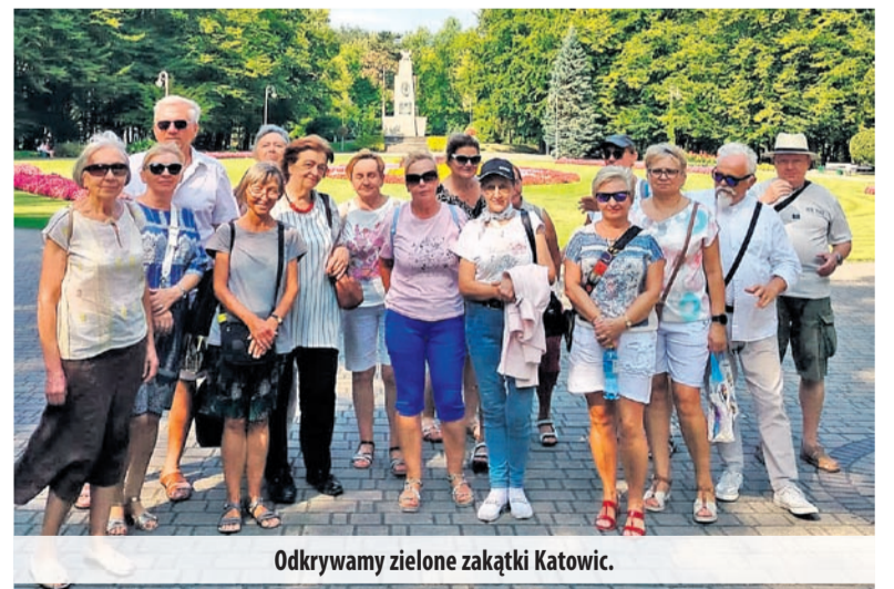
Odkrywamy zielone zakątki Katowic.

*BO - zajęcia bezpłatne z Budżetu Obywatelskiego.