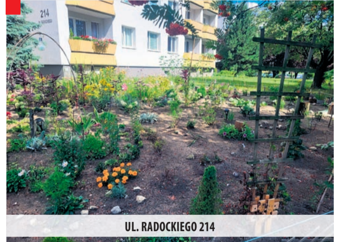
UL. RADOCKIEGO 214