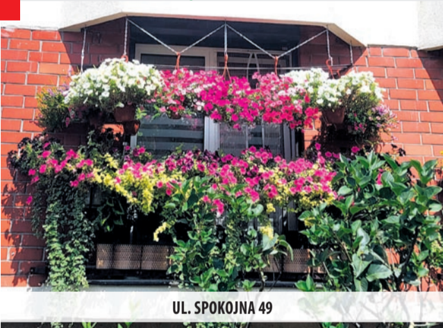
UL. SPOKOJNA 49