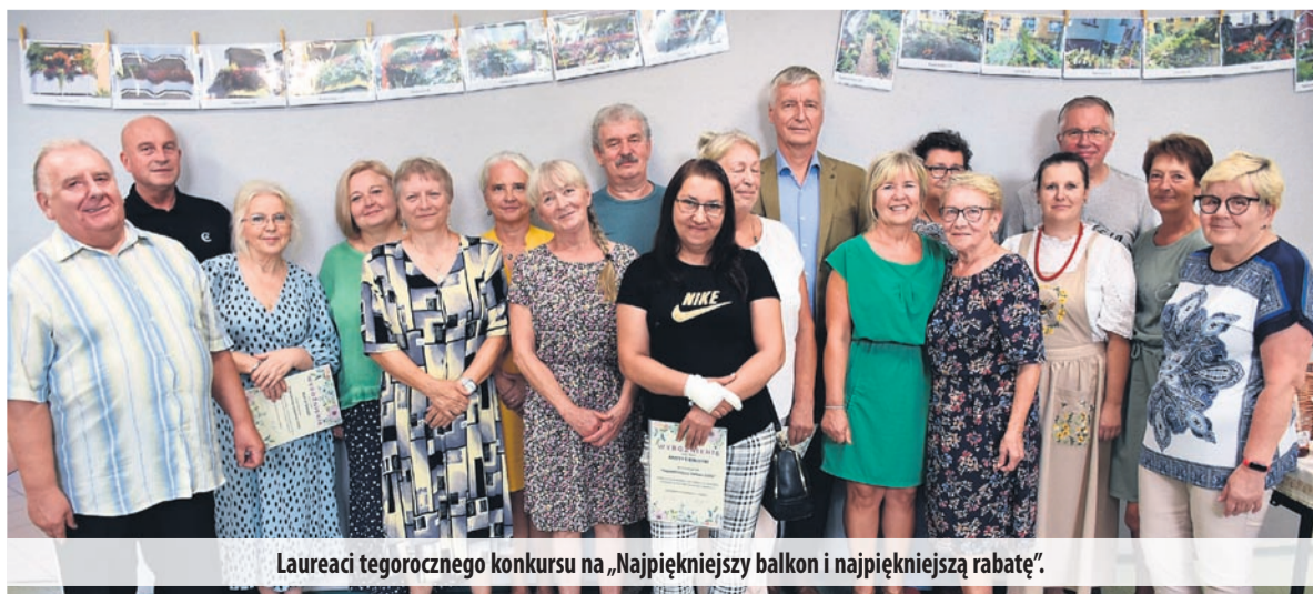
Laureaci tegorocznego konkursu na „Najpiękniejszy balkon i najpiękniejszą rabatę”.