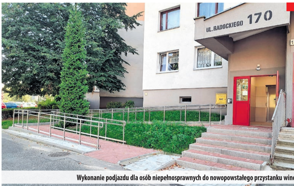
Wykonanie podjazdu dla osób niepełnosprawnych do nowopowstałego przystanku windy osobowej na poziomie ciągu pieszo-jezdnego w budynkach przy ul. Radockiego 170 i 192.