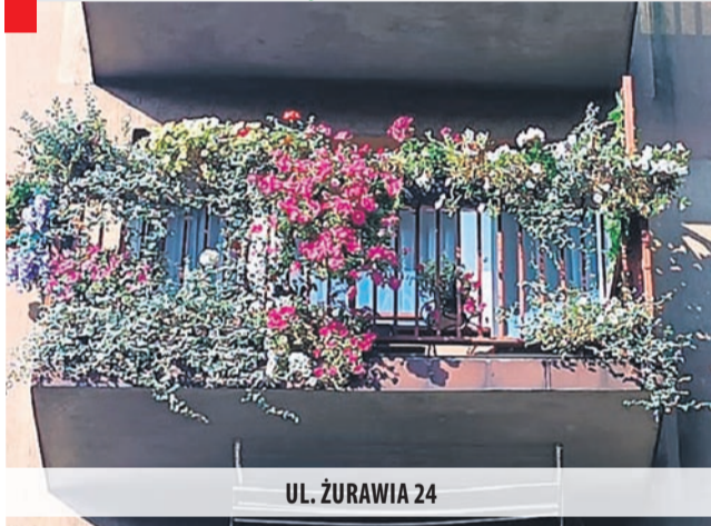
UL. ŻURAWIA 24