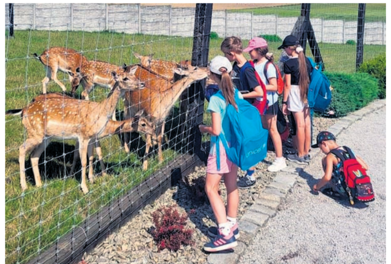
Wizyta w Parkowym Zwierzyncu.

Zapraszamy zatem na „Akcję Zima 2025”. ■