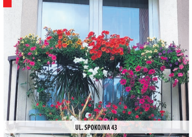
UL. SPOKOJNA 43