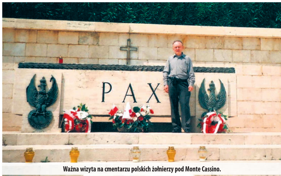
Ważna wizyta na cmentarzu polskich żołnierzy pod Monte Cassino.