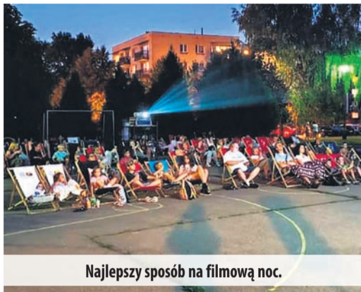
Najlepszy sposób na filmową noc.

Na osiedlu Targowisko mieszkańcy mieli okazję obejrzeć komedię „I znowu zgrzeszyliśmy, dobry Boże”. Ten francuski hit pełen zabawnych perypetii i rodzinnych problemów, w lekki i zabawny sposób przedstawiający różnice kulturowe, spotkał się z dużym entuzjazmem widzów. Wieczór pełen śmiechu był idealną odskocznią od codziennych trosk.