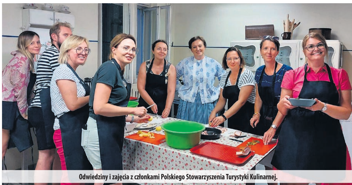
Odwiedziny i zajęcia z członkami Polskiego Stowarzyszenia Turystyki Kulinarnej.