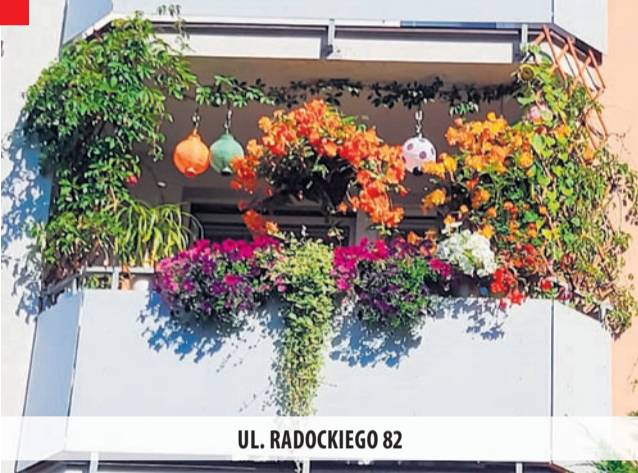
UL. RADOCKIEGO 82