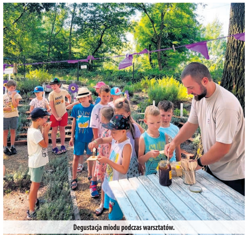
Degustacja miodu podczas warsztatów.