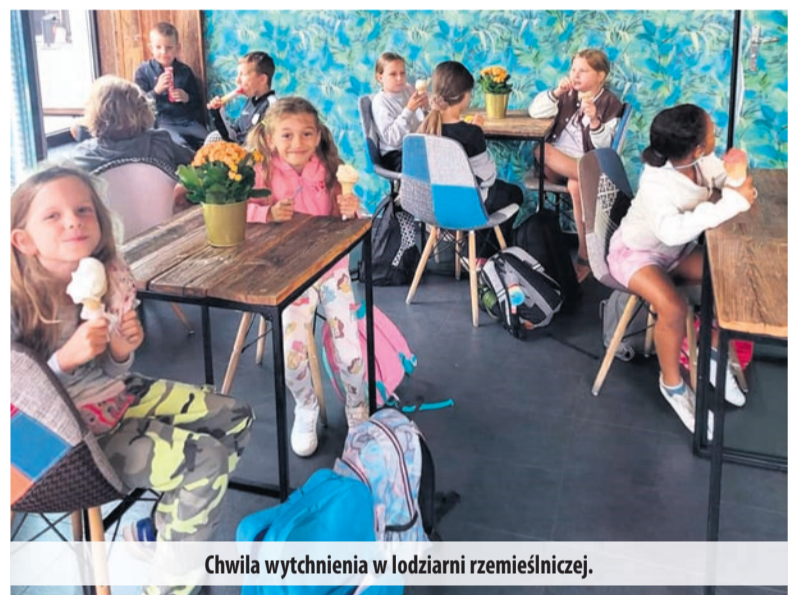
Chwila wytchnienia w lodziarni rzemieślniczej.