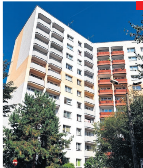
Remont balkonów w budynkach przy ul. Radockiego 198 i 220.