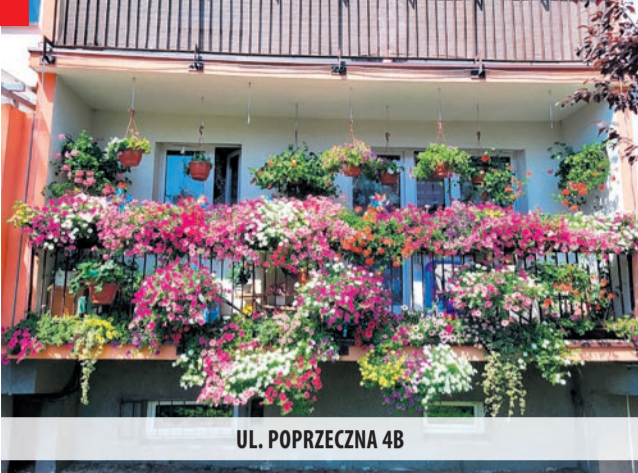
UL. POPRZECZNA 4B