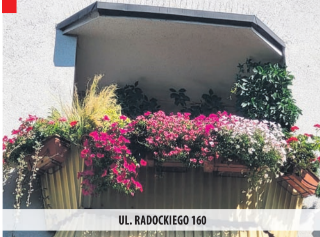
UL. RADOCKIEGO 160